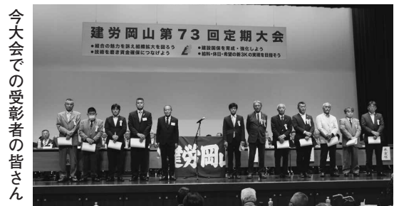
今大会での表彰者の皆さん

今回の大会会場では新たな試みとして、令和7年度に各支部が取り組んだ労力奉仕活動の写真と、県下23支部がそれぞれで作成している機関紙やお知らせ案内をプロジェクトにて映像展示し、参加者に公開しました。写真提供に協力いただいた支部に感謝します。