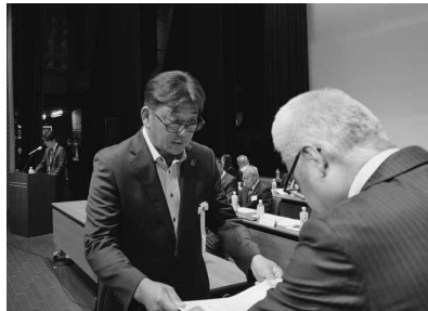
組織拡大表彰(なださき)