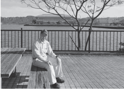
リラックスできるお気に入りの場所