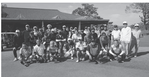
みんな笑顔で楽しくプレー

全建総連の顧問弁護士による、契約締結時及び既契約の顧客向けに対応できるような合意書のひな型と、契約前の顧客に対するおそれ通知の解説を組合ホームページで紹介しています（パスワードによる限定掲載）。