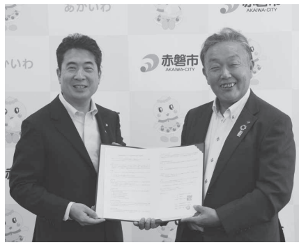
被災時の多様な支援体制を確認

5月29日に赤磐支部と赤磐市との「大規模災害時における支援活動に関する協定」の見直しに伴う調印式が赤磐市役所で行われ、建