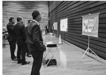
映像展示を見る参加者