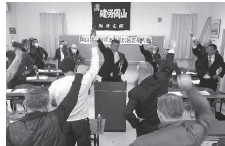
来年度の方針を確認 (倉敷支部)

いずれの支部においても全ての議案が無事承認。また今年度は70周年という節目の大会となった支部も多く、今年までの長い年月を支え、その時代が抱えた課題の克服のため懸命に奮闘した先人達の思いを受け継ぎ、次の時代に踏み出すことを各支部で確認されました。