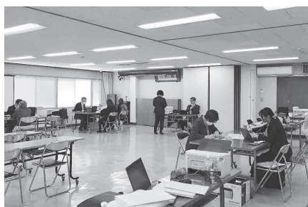
税金の相談をする組合員