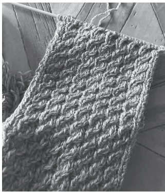
心を込めて編んでいます

とつぶやきながら編み進めていくのも楽しみの一つで、そんな風にならざるを得ない喜びのひとつです。一人ニヤニヤしながら「目が飛んでいないかな」ときつさやゆるさを確認しながら、最後に後処理をしたら完成です。 子どもも大きくなってきたので、昔みたい毎年あれ作って、これ作ってと言わなくな