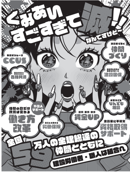
全建総連 春の組織拡大ポスター

【組織対策部】毎年4月5月は新加入者の掘り起こしの強化を図る『春の組織拡大月間』です。具体的 な取り組みとしては、現場や会合の場で未加入者に積極的に声をかけ、簡単な挨拶や近況を尋ねることから始めてみてください。困り事や悩みを聞き出すことができれば、