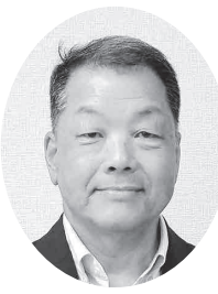
【國本住宅対策部長】

【住宅対策部】令和7年度も県下各支部が労働奉仕活動に取り組みました。実施先は幼稚園やこども園をはじめとした児童施設や独居老人宅、公民館などで、その内容は清掃や修繕など多岐に渡り、まさに地域に根付いた活動となりました。