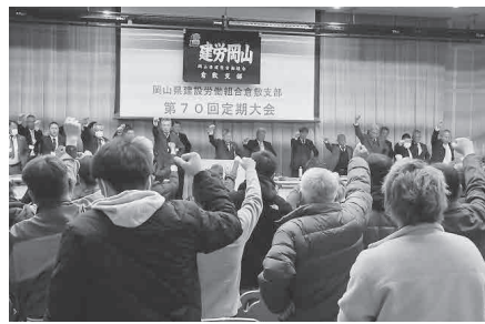
大いなる飛躍に向けて (倉敷支部)

倉敷支部では、今年度の活動報告と、令和7年度の運動報告と8年度に向けた担当部ごとの取り組みが提案されました。