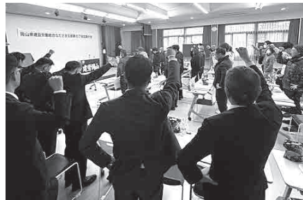
脱退防止に努める (倉敷支部)

倉敷支部では、今年度の活動報告と、令和7年度の運動報告と8年度に向けた担当部ごとの取り組みが提案されました。