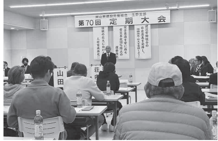
若い世代につなげよう (玉野支部)

13日に開催した新見支部では、依然として続く組合員数の減少と物価高騰などの厳しい現状を踏まえ、支部存続と組合活動維持のために支部費の3000円引き上げを求める議案が提出されました。