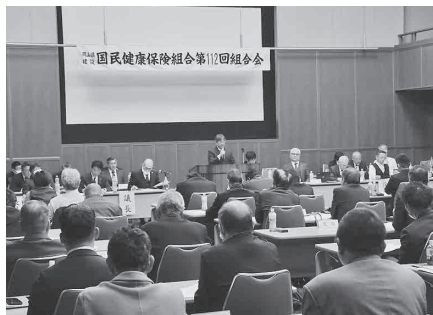
建設国保の安定運営を目指して

建設国保の歳入の約4割が国からの補助金で賄われています。建設国保の運営は補助金なしでは成り立ちません。補助金確保のため、ハガキ要請行動の協力をお願いします。