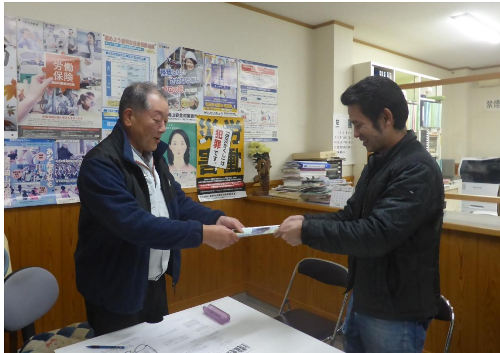
パンフレットを幹事から受け取る役員（上） 幹事の話聞きに集まった組合員の皆さん（左上）

令和8年が始まりました。 今年の10月から12月にかけて、県下青年部未結成・休止支部を対象に本部幹事が訪問活動に取り組み、支部役員と対面して青年部結成への理解と協力を訴えました。 建労岡山青年部は組合結成の翌年である昭和30年11月、四十数名の有志によって産声をあげ、昨年で70年を迎えました。この長い歴史の中で仲間が仲間を呼び、青年部を立ち上げる支部が増え、県下青年部の統一（昭和35