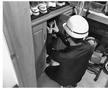
狭い箇所もすばやく作業(津山)