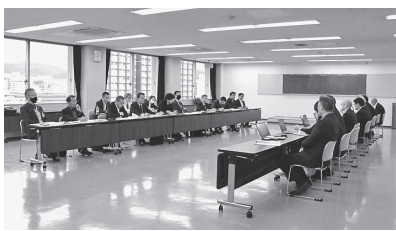
整備局交渉の様子

【賃金対策部】10月31日に中国地方県連・組合が集結して、広島合同庁舎へ建設技能者・職人の処遇