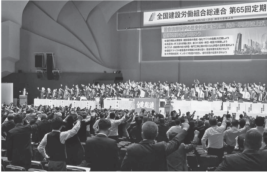
持続可能な建設産業を目指して団結ガンバろう

が述べられました。初日の全体会議では運動方針案として、100万人国会請願署名を力に、改正担い手3法を好機とした大幅な賃金・単価引き上げの要求・請求運動に取り組むこと、町場・住宅分野でのCCUSの普及とその活用に取り組み、建設国保の育成・強化、現行補助水準の確保を求め、アスベスト被害の救済・根絶を求め、インボイス制度の見直し・緩和措置の延長を求め、担い手確保・育成のため能力評価の活用を進めること等が提案されました。