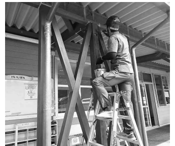
職人技が光る(新見)