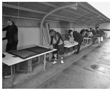
仲間との連携も大切(西大寺)

倉敷支部では10月27日、毎年実施場所としている倉敷市立西中学校にて生徒とともに新しい下駄箱を製作して設置しました。その他紹介が叶わなかった支部も含め、10月末時点で計19支部が関係各所の要望等に応じた奉仕活動に取り組んでいます。内容については改めてお知らせします。