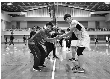
互いに讃え合う青年部選手

る可能性のある者に対する酒類を提供した者、酒気帯び運転をほう助したのものにも罰則が科されます。たかが自転車と軽視せず、今一度交通ルールを確認し、安全に自転車を利用しましょう。近年、自転車事故は増加傾向で、過去には事故を起こした運転者やその家族に数千万円の損害賠償を命じた判決もあります。自転車を運転される方は万が一の事故に備え、賠償責任保険に加入しているかどうかを確認しましょう。