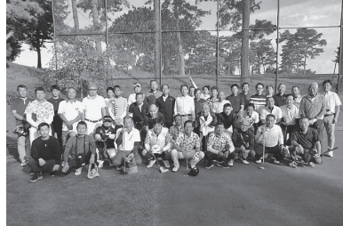
みんなで楽しい1日を過ごしました

【岩谷委員長】10月15日、第22回建労岡山ゴルフコンペが行われ、岡山倶楽部帯江コースに52人の有志が集まりました。始球式の意味合いも込めて一番にティーショットさせて頂き、緊張の中、打ったボールは右の斜面へ。第2打は松の木の間へ。今日もこんなもんかと自覚することができました。グリーンが速く、難しく感じました。みなさんもグリーンに悩まされていたのではないのでしょうか。