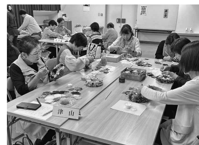
細かい作業もお手の物

【女性会】10月8日、組合本部3階会議室において女性会学習会を開催し、19人が参加しました。