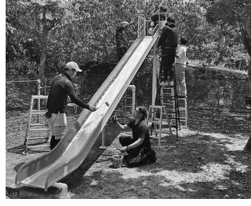
蘇っていく遊具(井原)