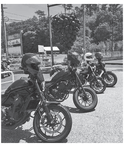
みんなでツーリング

「これから家族で遊びに行くのも少なくなるな」なんて感慨深く思わずに目頭が熱くなってきました。思えば、長女が小学校低学年から中学生の頃まで、会社では人手が足らず主人も私も昼夜問わず忙しくしておりました。そんな娘達の成長に思いを馳せていると、道の駅で駐車に失敗した長女がバランスを崩して、ゆっくりとバイクを倒して次