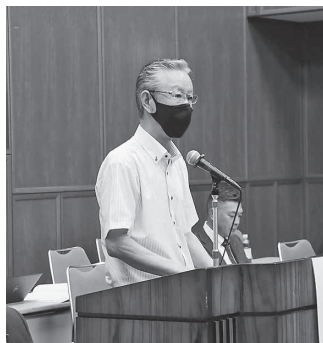
答弁を行う執行部

7月29日、岡山市北区の岡山国際交流センターにおいて、第109回通常組合会が開催され、組合会議員48人、理事・監事18人など合わせて計77人が出席しました。 令和5年度事業報告では、国保組合を巡る社会情勢として、国保組 合に対する関係予算総額が現行補助水準を確保したことや今年2月に「子ども・子育て支援法」の一部を改正する法律案が閣議決定されたこと等の報告があり、令和5年度の財政状況として、歳入合計は85億792万円、歳出合計は78億4,680万円となり、収支差引残額は6億6,122万円の赤字となりました。