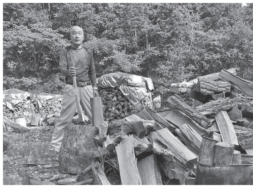
薪割りは結構シンドイ

最近海外製の薪ストーブが人気の中、あえて国産にこだわりの組立や取り付け、メンテナンスは自身で行う