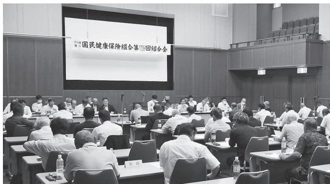
厳しい財政状況を乗り切ることを確認

7月29日、岡山市北区の岡山国際交流センターにおいて、第109回通常組合会が開催され、組合会議員48人、理事・監事18人など合わせて計77人が出席しました。 令和5年度事業報告では、国保組合を巡る社会情勢として、国保組 合に対する関係予算総額が現行補助水準を確保したことや今年2月に「子ども・子育て支援法」の一部を改正する法律案が閣議決定されたこと等の報告があり、令和5年度の財政状況として、歳入合計は85億792万円、歳出合計は78億4,680万円となり、収支差引残額は6億6,122万円の赤字となりました。