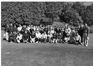
ゴルフ好きの精鋭達

健診未受診の方を対象とした日曜健診を上記日程で実施します。申込書は各支部より配布しています。詳しくは、所属支部へ問い合わせてください。対象者は、一般健診が無料で受診できます。(ただし、オプションは有料) 健診機関より届いた受診票に記載の受付時間を厳守の上、受診してください。体調不良時は、健診受診は控えていただくようお願いいたします。また、今後地域の実情に合わせた対策をとらせていただくことがあります。ご理解、ご協力をよろしくお願いいたします。対象者：健診未受診*である建設国保加入の組合員と配偶者、40歳以上家族 ※建設国保の補助のある他の健診と重複受診はできません。申込み：所属支部を通じて必ず申込みをお願いします。(完全予約制) 締切：健診日の1ヶ月前又は定員に達し次第