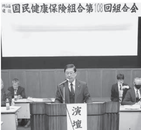
建設国保の安定運営に理解を

単年度収支赤字については、令和4年度の繰越金が当初予算から1億2000万円少なくなつたこと、国庫補助金のうち普通調整補助金が減額されたことなど様々な要因が重な