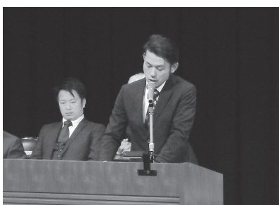
義援金協力を呼びかける青年部(西大寺)

議案提出では、能登半島地震の被災県連・組合への支援金の拠出について提案を行い承認されました。また青年部は義援金の協力を呼び掛けました。苦田西支部は鏡野町ペスタロッツ館夢ホー