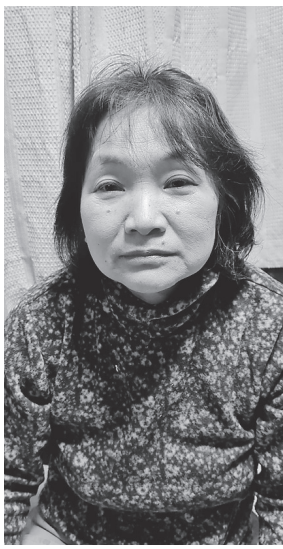
これからも夫を支えます

結婚して43年、3人の子に恵まれ育児に奮闘してきました。その子供も42歳、40歳、28歳。時が経つのも早いものです。色々ありましたが、43年よく持ったなと思います。 2年ぐらい前、夫の難病(パーキンソン病)を告げられました。その時が一番のショックで私は「なんで夫が」と言う気持ちで、自分の中で受け入れるまで は時間がかかりました。夫の口から漏れた「自分で良かった」との言葉に夫婦で泣きました。 医者からは家で休んでいるばかりだと病気の進行が早いと言われ、今は薬を飲みながらでも仕事に行っています。三男と夫と私は自営業(大工)なのでいつも一緒です。ケンカもありますが「今日は何か違う」などもわかるようになります。 脚立も恐く、かがみ仕事も辛く、できる仕事が減ってくるかもしれません。元々頑固で曲げない亭主関白の夫。病気のせいかな、もっと 難しくなりましたように思います。でも何かの度に「ありがとう」の数が増えた気がします。これからも夫を支えたいと思います。