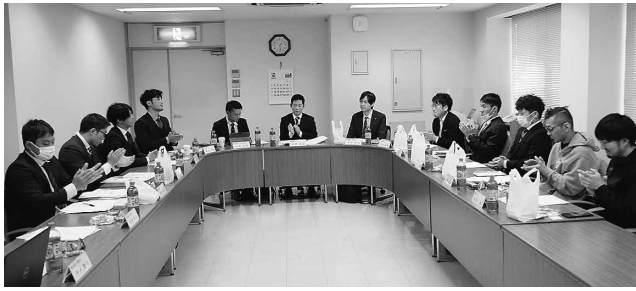
久し振りに対面した4県青年部幹部

【対象者】 令和5年11月1日以降に出産した建設国保に加入する被保険者。(建設国保に資格のある家族の方も対象) ※妊娠85日(4か月)以上の出産が対象です。(死産、流産、早産及び人口妊娠中絶の場合も含む) 【対象期間】 出産月の前月から出産月の翌々月(以下「産前産後期間」)までの保険料が対象。 ※多胎妊娠の場合は出産月の3か月前から6か月分の保険料 単胎の方 3か月前 2か月前 1か月前 1か月後 2か月後 3か月後 多胎の方 出産予定月 ※産前産後期間のうち令和6年1月以降の期間の分だけ保険料が還付されます。 (例: 令和5年11月出産の場合、令和6年1月分の1か月、令和5年12月出産の場合、令和6年1月分、2月分の2か月を還付) 【必要書類】 ①産前産後期間に係る保険料軽減届出書 ②住民票や母子健康手帳など親子関係・出産日が確認できる書類 ※必要書類を準備の上、所属支部へ届出ください。 出産後2年以内に手続きしてください。