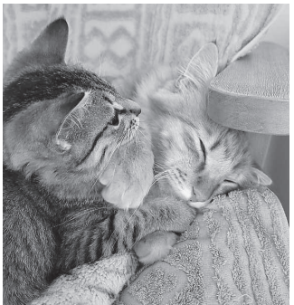
じゃれ合う我が家の猫

いていました。私以外にも2人ほしい人がいるとの事だったので「キジトラが希望だけど、引き取り手がいない子でいいのだから」と言っていてその日は帰りました。家に帰って子供達に「子猫をもらえるかもしれない」と言うと「良かったね」、「もっさり丸くなって寝てしまいましたが、いたずらも多いくらいです。本当に