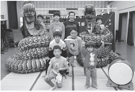
教え子達と一緒に