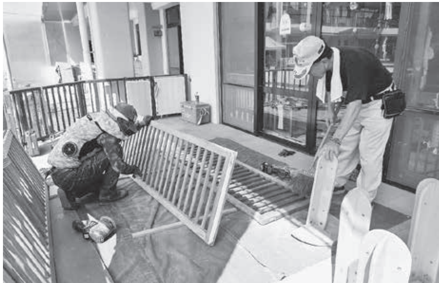
こども園の木製フェンスを修繕 (児島)

発行所 〒700-0024 岡山市北区駅元町23-12 岡山県建設労働組合(建労岡山) 電話 086-252-2338 FAX 086-252-0273 発行人 山本茂輝