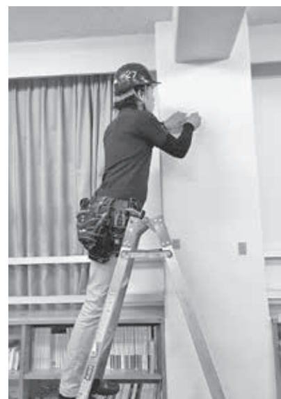
クラックの修復作業 (英田)

今年度の取り組み支部は倉敷(42)岡山(42)都窪(18)玉島(26)津山(6)児島(24)西大寺(26)総社(8)児島郡(7)玉野(17)赤磐(15)真庭(11)和気(61)高梁(14)井原(44)吉備(13)笠岡(19)新見(8)御津(18)苫田西(12)小田(24) 英田(55)苫田(7)です。※カッコ内は参加人数。 統一労力奉仕活動は組合員の技術技能を活用し技能者集団であることをアピールできる最高の機会です。地域社会への貢献という側面も併せ持ち、自治体からも大変喜ばれている活動です。参加頂きました組合員の方には心より感謝申し上げます。