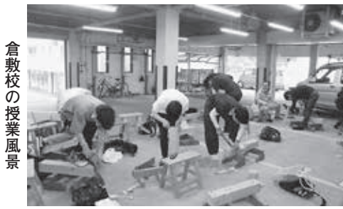
倉敷校の授業風景