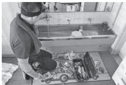
水道のトラブルを修繕 (和気)

【組織対策部】建労岡山の令和4年度末時点の組織人数は11,836人となり、平成24年度以来の年間減少となりました。 令和5年度は年間実増を果たすべく、4月1日時点の組織人数の7% (全支部合計82