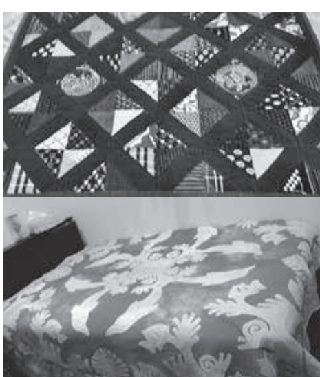
柄がアートになったお手製キルト

気持ちではじめましたが、古い布の小さなハギレをパッチごとに縫い合わせていくと柄がアートになるその素晴らしさに魅了され、タペストリーやクッション、バッグなど仕事の合間を見つけては夢中で作りました。出来上がった作品は友人や家族に差し上げたりして私自身も部屋のベットのカバーを製作し楽しんでおります。 コロナ禍でなかなか