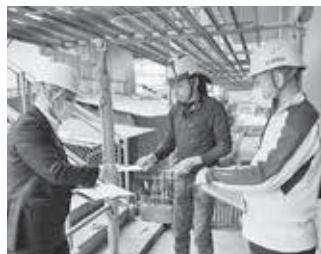
昨年の現場訪問の様子 (玉野)

【組織対策部】建労岡山の令和4年度末時点の組織人数は11,836人となり、平成24年度以来の年間減少となりました。 令和5年度は年間実増を果たすべく、4月1日時点の組織人数の7% (全支部合計82