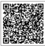
厚生労働省 ホームページ

【労働対策部】国内で輸入・製造・使用されている化学物質は数万種類にのぼります。その中には危険性や有害性が不明な物質が多く含まれ、化学物質を原因とする労働災害は国内で年間約450件発生しています。化学物質による労働災害防止のため、労働安全衛生規則の改正により新たな化学物質規制の制度が導入されます(改正の詳細は左記の2次元コードより確認してください)。