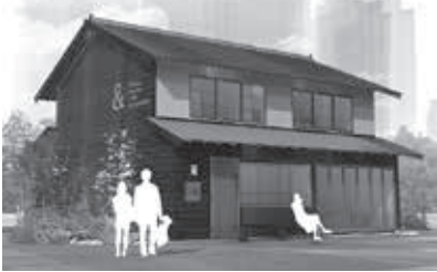
リノベ前(上)とリノベ後イメージ(下)