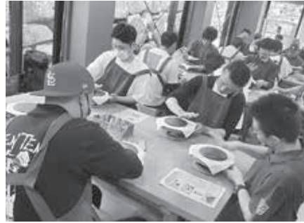
備前焼でオリジナルの皿を制作

その後、全国青協・谷岡総務より、仕事や組合活動等に繋げるSNSの活用方法についての講演が行われ、ツイッターやインスタグラムが現代において仲間同士の繋がりを追求する上で有効である