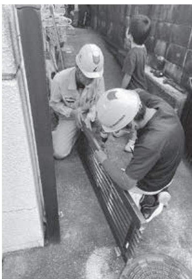
昨年の奉仕活動の様子

【住宅対策部 組合】 では、地域貢献を果たしていることと同時に、建設技能集団であることを地域住民にPRするために、8月の第3日曜日を統一日と定めて「労力奉仕活動」を行っています。 今年8月20日を統一日と定めて活動を行うしていきます。昨年は16支部で実施し、414人が参加し、小学校、児童センター、幼稚園、保育園、養護施設、独居老人宅の補修作業等を行いました。 奉仕活動は1976年に始まり、40年以上の歴史がある組合活動であり、奉仕先からは例年、温かいお礼のお言葉を頂いており、大いに期待されています。 8月の猛暑下の中での作業となります。熱中症防止対策のために、こまめな休憩や水分補給等を心がけ、安全に作業を行っていきましょう。