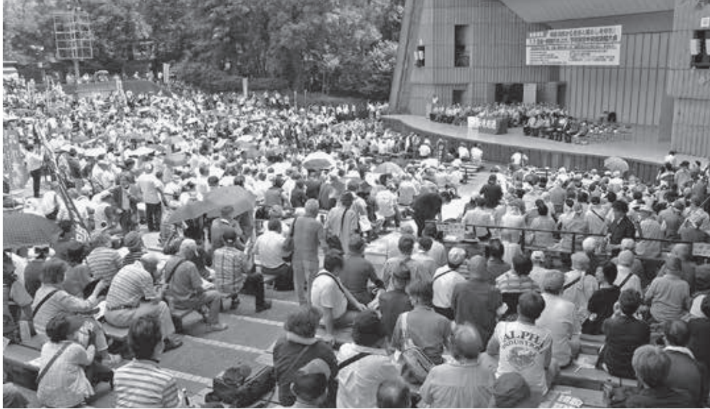
全国の仲間が日比谷へ集結

7月7日、東京・日比谷公園大音楽堂において「7・7賃金・単価引き上げ、予算要求総決起大会」が昨年同様、新型コロナウイルス感染症対策のため人数を絞って開催されました。全国48県連・組合から1,904人の仲間が集結。建労岡山からは国保理事5人、書記局1人が出席し全国の仲間と団結・強化を確認しました。