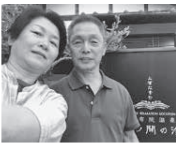
由布院温泉を満喫する東川夫婦

中、地域に愛され、地域に根差し、お客様に信頼して頂ける会社になっていきたいと思っています。