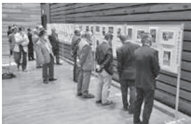
教宣コンクール、写真展の様子