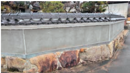
わが家の塀、いつ出来るの？