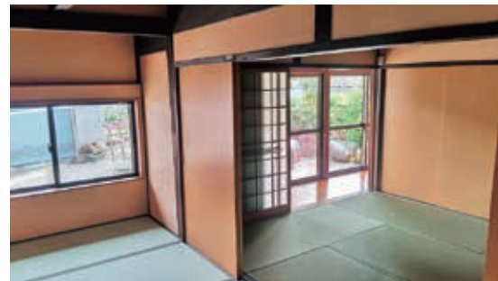
築100年越えの古民家リフォーム