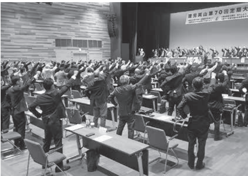
新体制で団結ガンバロウ

岩谷委員長より「全ての運動は組織を守るために進んでいます。みんなが足並み揃えてひとつになれば大きな力を発揮できると確信しています」との挨拶がありました。