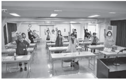
新年度も女性会活動をガンバロウ

室温28℃以下、湿度70%以下 衣類を涼しく工夫 日差しを避ける 冷却グッズの活用 上表は、熱中症対策に効果的な食べ物、飲み物です。熱中症予防代表ドリンクと言えませんが、これは多くの糖分も含んでいますが、一時的に飲むのは構いませんが、習慣的に多く飲むのは肥満等の原因になるので控えましょう。