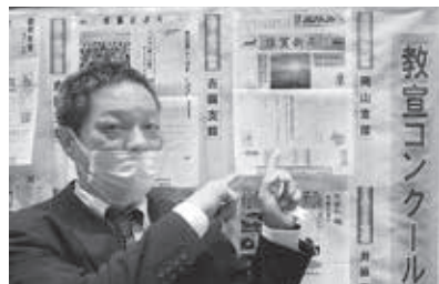
最優秀賞を受賞(岡山)