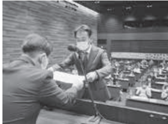
組織拡大表彰(新見)