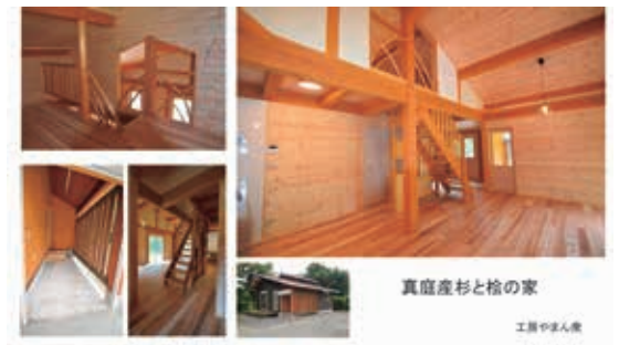
真庭産杉と桧の家