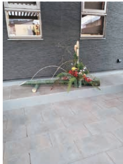
真庭の竹で作った正月飾り