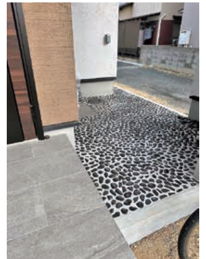
自宅 健康足つぼエリア 都窪支部 森安 正忠 (配管工)