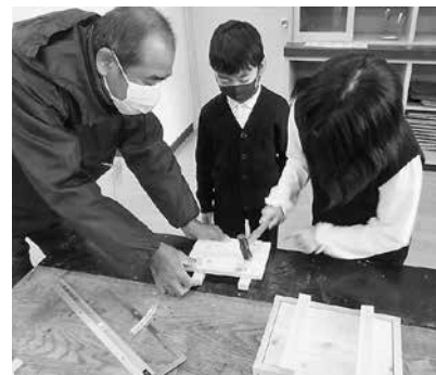
慣れないかなづちに大奮闘

【総社支部】12月16日、総社市の維新小学校で木工教室を開催しました。 教室には小学3年生、4年生の10人ほどが参加し、一人1つずつ木の製のパチンコを作成。板に釘を打つ練習を行いながら、正しいかなづちの持ち方や釘を打つ力の入れ具合を学びました。 下準備として、あらかじめ板に釘穴を開け、板もユニットに分けて切っておきましたが、かなづちを使ったことがない子供も多く悪戦苦闘。しかし、一緒に作ったりアドバイスをしたりして いと「楽しかった」という感想も聞くことができ、ケガもなく無事楽しい教室を終えることができました。 今後の担い手確保のためにも、小さいころから木や釘に触れ、物を作る経験をすることが大切です。将来大工になりたい子供が増え、少しでも後継者不足の歯止めになれば嬉しいです。今後もこのようなイベントを行い、より多くの子供たちに大工の仕事に触れてほしいと思います。