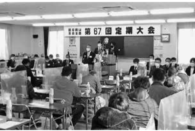
組合員のための組合を(西大寺)