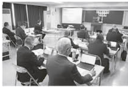
メイン会場の様子

12月2日、令和4年度合同会議を開催し、組合員63人、執行委員26人、書記局3人、合計92人が出席しました。今年度は新型コロナウイルス感染症拡大に伴い、