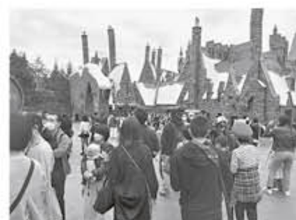
USJハロウィンイベントで大盛り上がり

【御津支部】10月8日、9日の2日間、御津支部青年部とその家族の総勢17人で、神戸と大阪へ支部親睦旅行に行ってきました。1日目は神戸にある