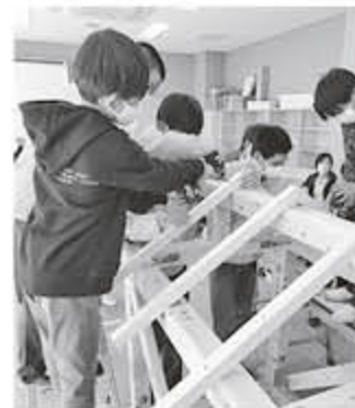
真剣に作業する小学生

【玉野支部】11月5日、玉野市立玉野商工高校で行われた「キッズビジネススタウン」に協力団体として参加しました。これは、玉野商工が市内の小学生を対象に行う職業体験イベントで、様々な仕事について、疑似体験を行いながら楽しく学ぶことができます。私も子供が小学生の時に保護者として参加しましたが、協力団体の側としての参加は初めてで、ここ数年は新型コロナウイルスの影響で中止になっており、久しぶりの開催でした。玉野支部は建設業の職業体験として、ミニ上棟セットを用意。建