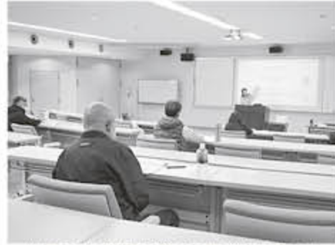
補見先生の説明を熱心に聞く参加者の方

12月8日に「知らないで通らない！働き方改革学習会」が開催されました。講師 規制、年次有給休暇の確保な取得、残業代（割増賃金）、時間外労働・休日労働に関する協定届「36（サブプロク）協定」について4つのテーマで講義がされました。