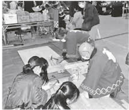
木工教室で組合をPR

比較してすべての職種、立場において上昇しています。事業主の支払賃金も上昇しており、コロナ禍や諸経費の高騰という苦境に立たされても、自分たちの力で仕事を確保するという組合員の意地と心意気が示された結果となりました。また建設キャリアアップシステム(CUS)については、知ってはいないが登録していない割合が依然として高く、登録のメリット等の周知活動が必要であることがうかがえます。ご協力頂きました組合員の方には改めて感謝申し上げます。